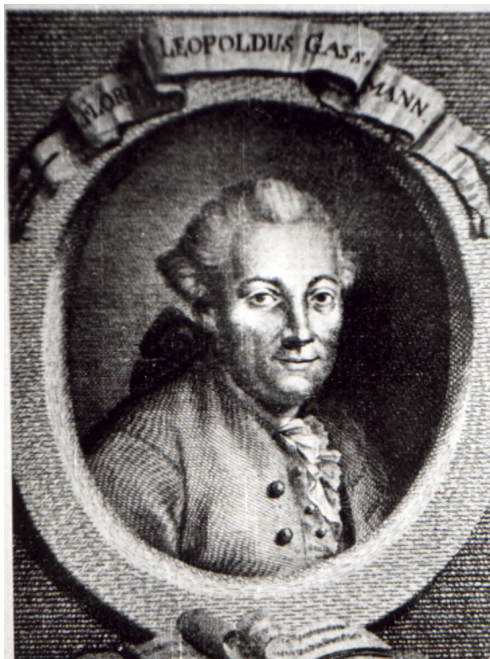
Florian Gassmann, Komponist 3.5.1729 -2.1.1774 (nach einem Stich von J.Balzer)